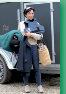
Voll bepakte Turnier-Mama