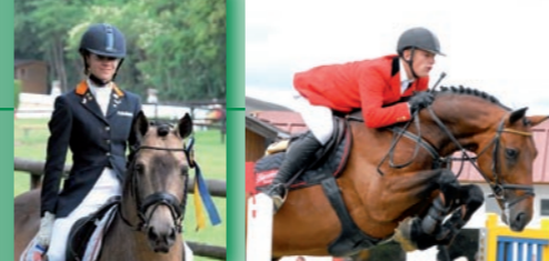
Ein korrektes Outfit ist nicht nur eine Frage des guten Aussehens, sondern auch der Sicherheit

darüber hinaus einen insgesamt gepflegten Eindruck hinterlassen sollten, ist wieder eine Frage allgemeiner Höflichkeit und gegenseitiger Achtung. Deshalb gilt auch bei der Parcoursbeurteilung: Bitte korrekt im Prüfungs-Outfit!