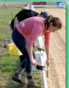
Ohne den Einsatz der Ehrenamtler gäbe es die meisten Turniere nicht

sind leider an der Tagesordnung. Doch auch hier gilt: Viele der Meldestellen-Mitarbeiter sind Ehrenamtler, manche haben diesen „Job“ zum ersten Mal. Sie alle geben ihr Bestes. Und selbst wenn die Meldestelle von Profis betrieben wird, ist's noch lange kein Grund, ihnen gegenüber unhöflich zu sein. Man kann nämlich davon ausgehen, dass alle dasselbe wollen: einen möglichst perfekten Turnier-Ablauf. Deshalb: mit ein wenig Geduld, gepaart mit dem ein oder anderen „Bitte“ und „Danke“ kommt man auch ans Ziel.